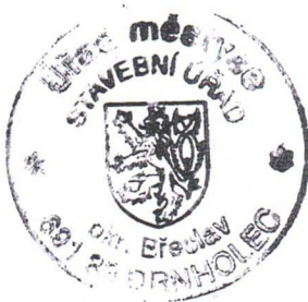
Eva Studená odborný referent stavebního úřadu

Stavební povolení podle § 198 stavebního zákona pozbývá platnosti, jestliže nebylo zahájeno provádění záměru v době platnosti stavebního povolení. Povolení pozbývá platnosti také dnem, kdy stavební úřad obdrží oznámení stavebníka o tom, že od provedení stavebního záměru upouští. Bylo-li provádění záměru zahájeno v době platnosti povolení, prodlužuje se platnost povolení na 10 let ode dne nabytí právní moci povolení nebo rozhodnutí o prodloužení platnosti povolení.